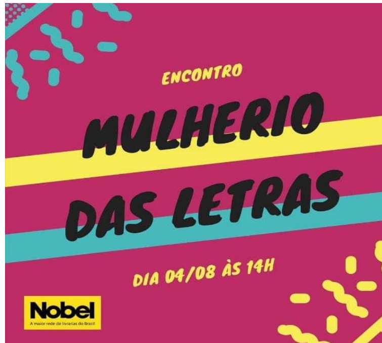
Card de divulgação do Encontro Mulherio das Letras em Campina Grande

Em 2019, o Leia Mulheres de Campina Grande também integrou programação do Encontro da Nova Consciência, evento ecumênico realizado há mais de 20 anos na cidade, participando de mesa-redonda denominada Resistência feminista e a luta das mulheres .