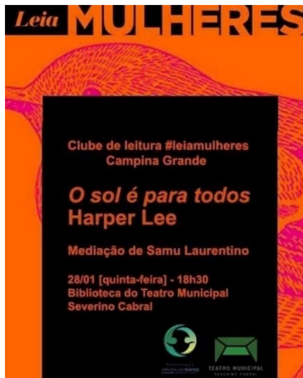
Card de divulgação do primeiro encontro do Leia Mulheres de CG