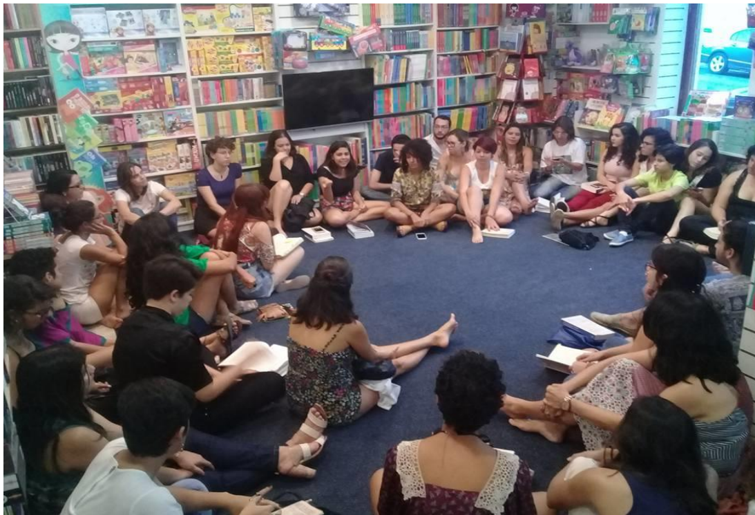
Foto do encontro realizado em março de 2018

Fonte: Facebook do Leia Mulheres de Campina Grande, 2018