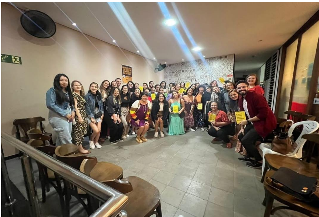
Foto do encontro realizado em março de 2023

Fonte: Instagram do Leia Mulheres de Campina Grande, 2018.